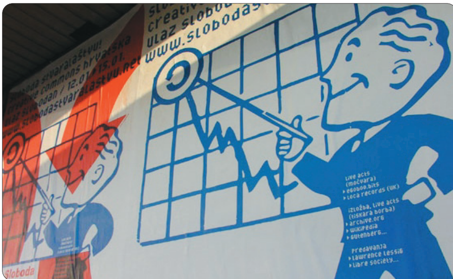
▲ Plakat za festival "Sloboda stvaralaštva!"

■ Lawrence Lessig govorio je između ostalog i o ograničavanju slobode na Internetu pod izlikom suzbijanja piratstva te kulturi slobodnog dijeljenja radova