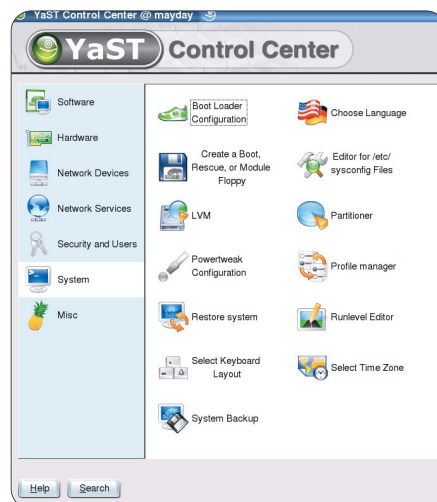
▲ YaST2, grafički alat za sva podešavanja sustava

Što se tiče instalacije i rada, mogli bismo cijelu distribuciju nazvati Yast-centričnom. Alat nas prati tijekom cijele instalacije, a koristit ćemo ga i prilikom bilo kakve naknadne konfiguracije sustava. Mogli bismo zaključiti kako je to jedan od najbolje riješenih postupaka instalacije koji smo vidjeli. Dovoljno je jednostavan da ne odbije početnike, a sa zaista opsežnim detaljima u naprednom načinu rada (primjerice, izravno mijenjanje konfiguracijskih datoteka) da čak i okorjeli profesionalci mogu zadovoljno trljati ruke. Nije imao problema i zaista možemo reći kako je napravio sve bez intervencije. Brinuli su se čak i za ljude koji će pisati članke o distribuciji, budući da je moguće raditi i screenshote tijekom insta-