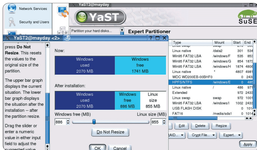
▲ Nova mogućnost SuSE 9 je i promjena veličine NTFS particija

dowse žele zamijeniti Linuxom i na desktop računalima. No ni to im još uvijek nije moglo dati revolucionaran probaj na tržište niti povratak na staru slavu.